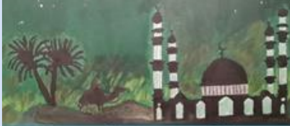
Kategorie 4, 15-21 Jahre