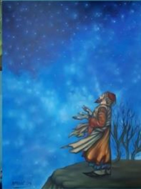
Kategorie 5, ab 21 Jahre