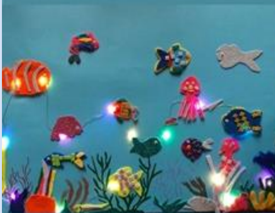
Kategorie 2, 6-9 Jahre